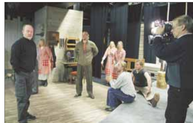
Perjantaina, raskaan viikon päätteeksi. Harjoitukset kiinnostavat televisiotakin.