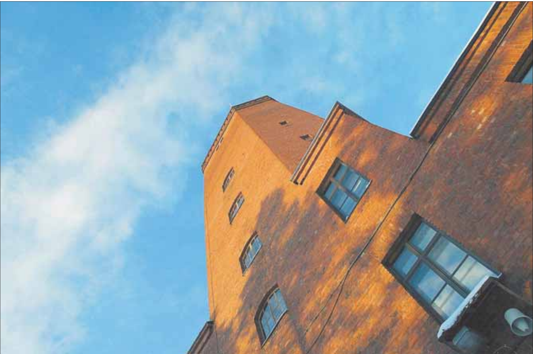
Kaupunginteatteri sai lisätilaa vanhalta palolaitoksesta vain viisi kuukautta sitten.