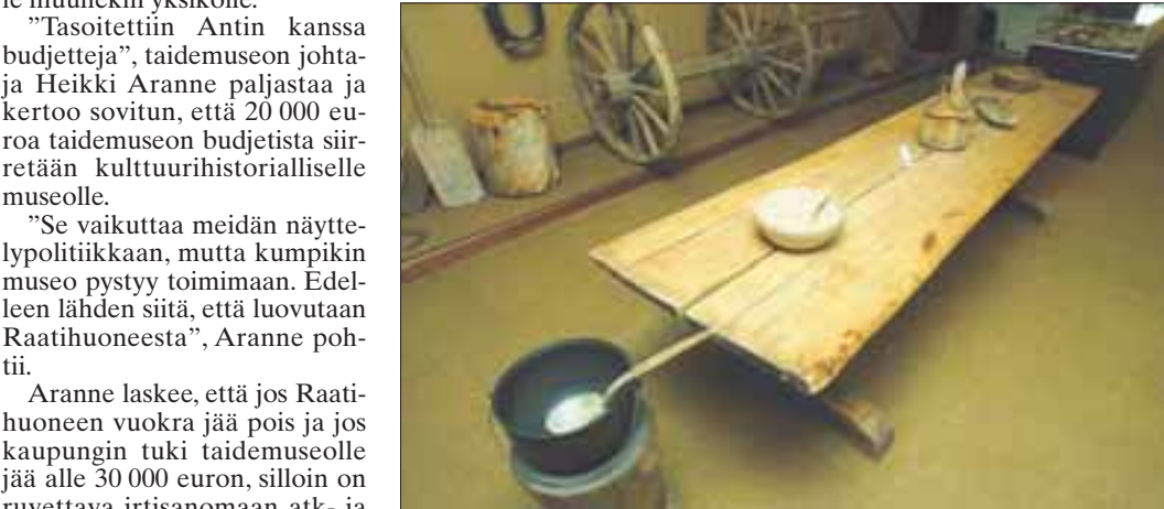
Kainuun Museo pysyy Asemakadulla.

”50 000 euroa on se meidän raja. Sillä pystytään pitämään talo käynnissä.”